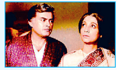
'आंधी' में सुवित्रा सेन के साथ संजीव कुमार

सुपर स्टार का ग्लैमर, हिट कराने का तमगा और स्लिम-टिम फिगर अगर किसी हीरो की इमेज को एक डेकोरम देता है, तो किसी भी भूमिका को परफेक्ट तरीके से करना भी किसी फिल्म को हिट कराने की गारंटी हो सकती है। यह बात सिद्ध की थी संजीव कुमार ने। वह एक ऐसे कलाकार थे, जिनके बारे में कहा जाता था कि वे कोई रोल निभाते नहीं, उसे पूरी तरह जीते थे। जिस तरह हिंदी फिल्म इंडस्ट्रीज में दिलीप कुमार, अमिताभ