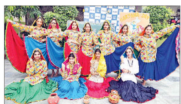
सोनीपत। प्रस्तुति देते हुए बच्चे।