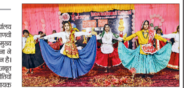
पारंपरिक परिधान कुर्ता और दामम में समूह लोक नृत्य की प्रस्तुति देते विद्यार्थी।