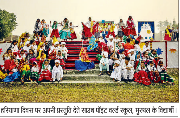
हरियाणा दिवस पर अपनी प्रस्तुति देते साउथ पॉइंट वर्ल्ड स्कूल, मुखल के विद्यार्थी।