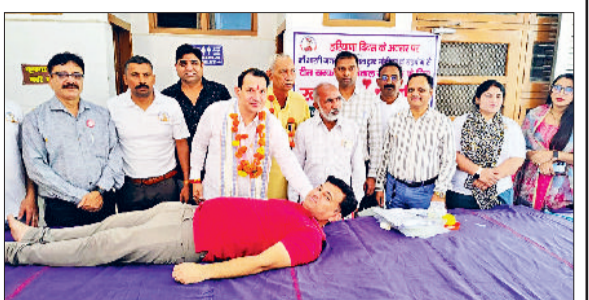
सोनीपत। रक्तदाता का हौंसला बढ़ाते हुए।