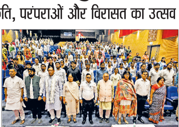
सोनीपत। कार्यक्रम में पहुंचे प्रशासनिक अधिकारी व नेतागण।