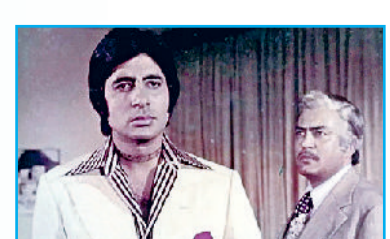
'त्रिशूल' में अमिताभ के पिता के किरदार में संजीव कुमार

दूसरे को कह देते थे-संजीव कुमार बन रहे हो? संजीव कुमार के द्वारा निभाए गए यादगार किरदारों में 'मौसम' के डॉक्टर अमरनाथ को कैसे भूला जा सकता है? इस फिल्म में उनका डबल रोल, शर्मिला टैगोर के रोल से किसी तरह से कमतर नहीं रहा। इसी तरह फिल्म 'त्रिशूल' तो अमिताभ की कही जाती है, लेकिन इसमें संजीव कुमार ने एक ऐसे व्यापारी का रोल प्ले किया, जो अंजाने में ही अपने बेटे से व्यापारिक संघर्ष कर रहा होता है और उसे पता ही नहीं चलता। इसमें पिता-पुत्र के संवाद, दो प्रतिद्वंद्वी व्यापारियों को उस लड़ाई का प्रतिनिधित्व करते हैं, जिसमें वे अपनी जीत के लिए किसी भी स्तर तक जा सकते हैं। उन पर फिल्माए गाने भी हुए हिट: संजीव कुमार पर फिल्माए गाने भी सुपरहिट रहे। 'अनोखी रात' का गीत 'ओह रे ताल मिले नदी के जल में, नदी मिले सागर में', 'खिलौना' का 'खिलौना जानकर तुम तो', 'सीता और गीता' का 'हवा के साथ-साथ, 'मेरी भीगी भीगी सी पलकों पे', 'आंधी' का 'तुम आ गए हो, नूर आ गया है', 'मौसम' का 'दिल ढूँढता है फिर वहीं फुसंत के रात-दिन' और 'सिलसिला' का 'रंग बरसे', हर दौर के हिट गानों की श्रेणी में गिने जाते हैं। अधूरी रही प्रेम की दास्तान: संजीव कुमार ने जिस तरह से फिल्मों में अपना परचम लहराया, उसी तरह से उनके प्रेम के चर्चे भी खूब सुने जाते रहे। हेमा मालिनी के साथ के किस्से तो सर्वाधिक चर्चित रहे ही हैं। सुलक्षणा पंडित के साथ भी उनकी जोड़ी चर्चित रही पर वह भी अपने मुकाम पर पहुंचने से रह गईं। खुद के बारे में भी कई अपनी ही भविष्यवाणी को सच साबित करते हुए जीवन के पचास बसंत पूर्ण करने से पहले ही 6 नवंबर 1985 को अनंत आकाश में हमेशा-हमेशा के लिए विलीन हो गए। k